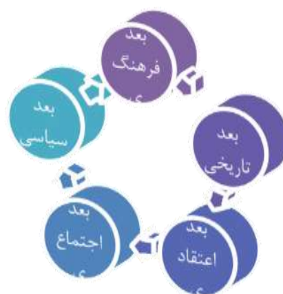
ابعاد ضرورت طرح مهدویت

یکی از وظایف ما مسلمانان، زمینه‌سازی و گسترش فرهنگ مهدویت و جلوگیری از تأخیر در ظهور آن حضرت است. از جمله تبیین استراتژی انتظار، آسیب‌شناسی، دشمن‌شناسی. ۱۵